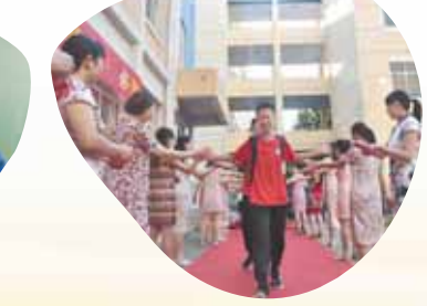
6月20日,学校教师身穿旗袍,为即将参加中招考试的学子加油。