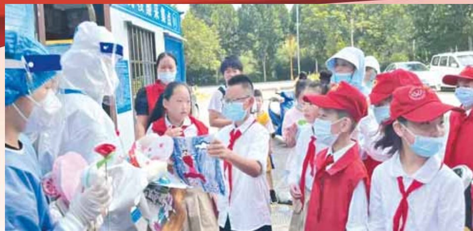
学校三一中队在暑期开展慰问防疫工作人员活动。

文明,是灿烂的笑容;文明,是动人的风景。鹤壁,一个仙鹤居住的地方,一座《诗经》“流淌”的城市,孕育了一所用文明书写美好回忆的学校。“鹤壁市文明校园”淇滨区明达小学东襟高铁,西带龙门,北依大学府,南傍淇水湾,占地48.7亩,建筑面积14484平方米,有45个各具特色的教学班、105名锐意进取的教师、2828名朝气蓬勃的学生。