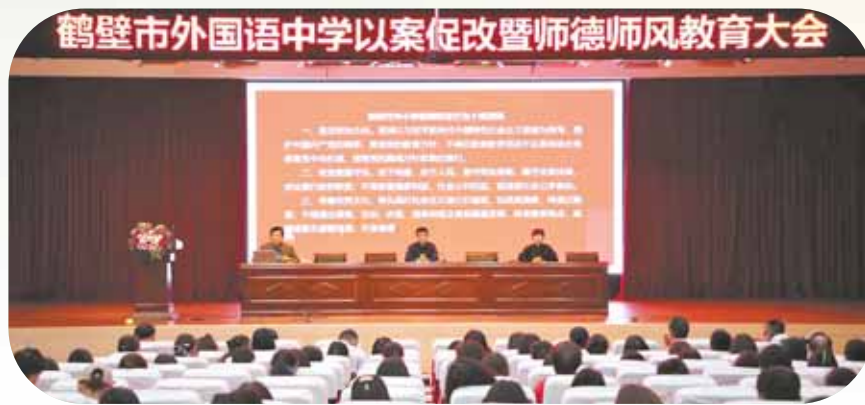
5月份,学校举行以案促改暨师德师风教育大会。