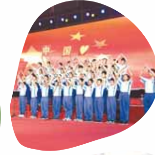
5月20日,市外国语中学艺术节在育人广场举行。