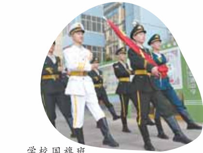
学校国旗班日常训练。

学校通过专题学习、专题谈话、专题宣讲、专题测试等引导教师坚定理想信念,厚植爱国情怀,涵养高尚师德。每学期开展优秀教师评选活动,引导教师树立高尚品德,争做“四有”好老师。