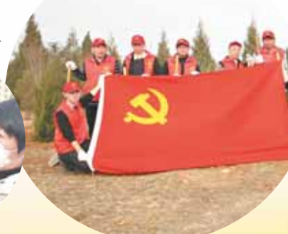
学校组织党员志愿者到市烈士陵园植树。