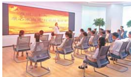
“喜迎二十大,童心永向党”讲红色故事比赛。