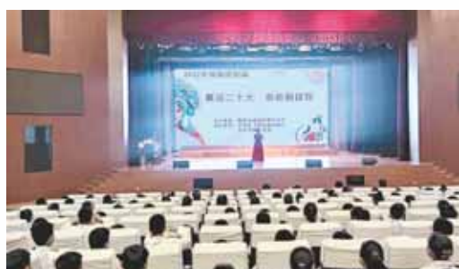
“喜迎二十大,奋进新征程”戏曲进校园活动。