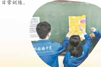
学校举行“抗疫+备考”心灵护航活动,学生在心愿纸上写下梦想和祝福。