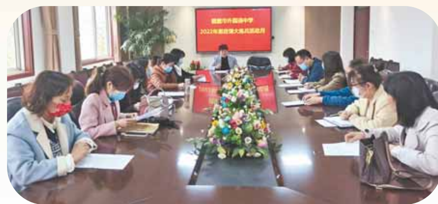
4月份,学校组织教师开展思政大练兵活动。