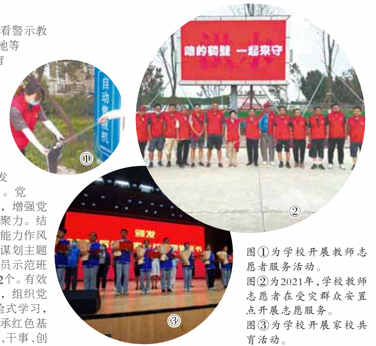
图①为学校开展教师志愿服务活动。图②为2021年,学校教师志愿者在受灾群众安置点开展志愿服务。图③为学校开展家校共育活动。

例会、专题党课、观看警示教育片、走进红色基地等方式,开展主题教育活动,提升党员的政治素养,激发教师爱岗敬业、教书育人的内在动力,做到将学习教育抓在经常、融入日常。 注重实效,激发党员干事创业活力。党支部创新活动方式,增强党组织的吸引力和凝聚力。结合党史学习教育、“能力作风建设年”活动,精心谋划主题党日活动,设立党员示范班16个、党员示范岗32个。有效发挥红色资源优势,组织开展沉浸式、体验式学习,重温革命传统,传承红色基因,营造文明、和谐、干事、创业的良好氛围。