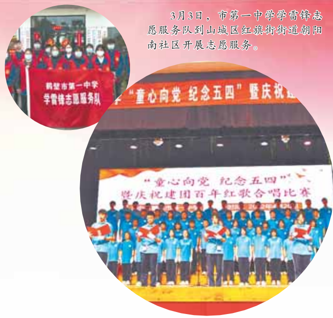
3月3日,市第一中学学雷锋志愿服务队到山城区红旗街道朝阳南社区开展志愿服务。