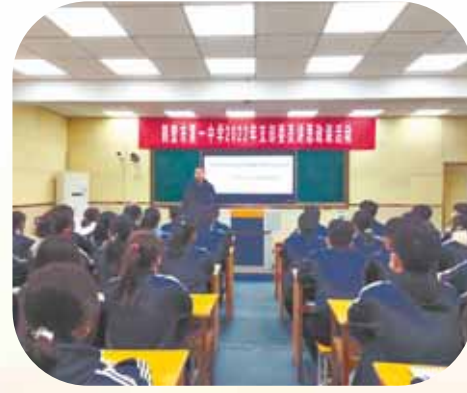
3月23日,市第一中学开展党支部委员讲思政课活动。

彻落实,通过完善评价激励机制,加强师德考核监督、学习道德楷模、签订承诺书、设立监督电话等,营造风清气正的氛围。 建立名师工作室,宣传“名、特、优”教师先进事迹,评选出各个岗位的先进模范,传递教育智慧,提升榜样模范带头作用。近年来,学校入选国家级骨干教师2人、省市级名师7人、市优秀共产党员6人。