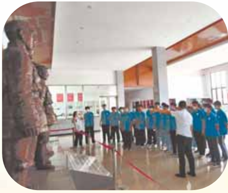
市第一中学在石林红色教育基地开展研学旅行活动。