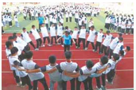
▲ 开展大型团体心理辅导活动。 ▲ 学校教学楼。

加强师德师风建设,全面提高教师队伍素质。学校深入学习《新时代中小学教师职业行为十项准则》,贯彻落实《关于全面加强和改进新时代师德师风建设的意见》,开展师德教育,完善师德奖励制度,将师德纳入教师绩效、评优评先、职称评聘等考核;开展师德第一课、师德征文及演讲比赛等活动,大力选树师德典型。