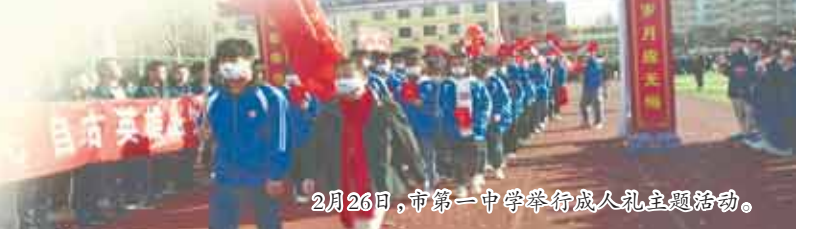
2月26日,市第一中學舉行成人禮主題活動。

灾日”系列活动、防溺水专题教育。定期开展系列法制主题教育活动,加强校园欺凌行为预防治理,将法治安全教育全面融入课堂,增强师生法治意识,引导学生树立正确的世界观、人生观、价值观,在校园营造良好的学法、知法、懂法、用法氛围,构建安全校园、文明校园。提高学校应急处置能力和水平,建立完善疫情防控、防汛、防震等突发事件应急响应机制,为师生筑起安全和身心健康的生命防线。学校的经验做法被《中国教育报》等多家媒体报道推广。