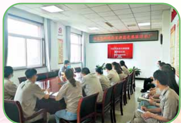
市生态环境局深入企业宣讲习近平生态文明思想。

党建+主业 锤炼铁军提能力 持续改善生态环境质量是市生态环境局的职责所在。今年年初以来,该局以党建为引领,大力开展污染防治系列行动,空气、水、土壤质量改善明显。 截至9月10日,我市大气环境综合指数为4.877,同比下降1.5%,改善率全省排名第二;1月至6月,我市7个国控省控断面水质均值均达到省定目标,并优于目标值,城市集中式饮用水源地取水水质达标率为100%;受污染耕地安全利用率达到100%,地下水国家考核点位达到标准要求。 在提高执法效能和优化营商环境方面,该局出台《鹤壁市生态环境局进一步加强服务保障企业绿色发展十项措施》,深化服务保障重大项目建设“三个一批”。依托“万人助万企”“我为群众办实事”“锻造作风、提能力、优环境,绿色映企百人行”主题活动,在全系统开展企业环保手续办理评比、生产技术指导、政策法规宣讲以及差异化环境监管柔性执法等活动,鼓励党员干部在帮助企业解决生态环境问题过程中,不断增强服务意识,提升工作能力。