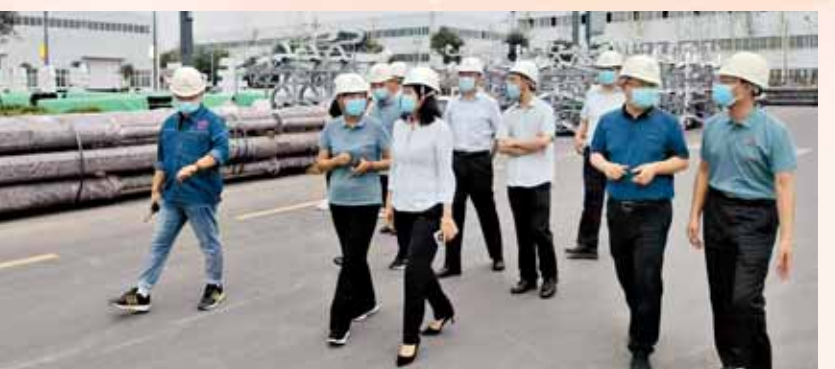
省银保监局到建行鹤壁分行重点客户处调研行走进万企活动。

本报讯(鹤壁融媒首席记者 张志嵩 通讯员 姬闻钊)为进一步支持实体经济,助力企业纾困解难,建行鹤壁分行坚决贯彻落实市委市政府、监管部门和上级党委关于金融服务实体经济的要求,提高站位、扛稳责任、主动作为,聚焦重点领域和薄弱环节,充分发挥地方金融主力军作用,全力支持服务地方经济发展,持续加大信贷投放力度,调整信贷结构,支持小微企业发展。截至9月底,该行各项贷款余额133.3亿元,较年初新增15.59亿元,以建行力量护航稳定经济大盘,为我市新时代高质量发展示范城市建设提供有力金融支持。