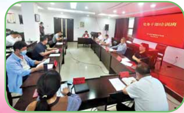
5月27日上午,市生态环境局机关党委举办党务干部培训。邀请市委党校院内法规和党风廉政建设研究中心副教授李振华为全局党务干部进行党务知识培训。

党建+学习 凝心铸魂强根基 “开展学习教育活动是抓好党建的基础性工程,是党员干部了解大政方针、掌握最新知识、找出短板漏项的最有效方式之一。”市生态环境局党组书记、局长任晓云表示,该局始终把学习作为一项长期、系统的政治任务来抓。无论业务多繁忙,该局理论学习中心组每月集中学习、党支部每周政治学习、“第一议题”学习等从未间断,每一名党员干部的笔记本上密密麻麻地记录着学习内容和心得体会。 在人才培养方面,该局制订了不同层次、不同形式、不同主题的年度教育培训计划,组织全员参加省生态环境厅理论测试,实现了以考促学促提升的目的;依托省干部网络学院等线上平台,督促党员干部积极接受党性、廉政、法制教育。 此外,该局以创建“五星”支部为契机,积极推进模范生态环境机关评选工作,全面提升党支部规范化、标准化建设水平;持续开展全市生态环境执法大练兵、大比武活动,推动各县区生态环境执法队伍在实战中锻炼工作能力,在比拼中查找自身不足。