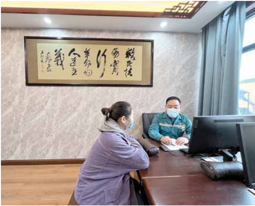
浚县卫贤镇中心卫生院中医科医生正在问诊。