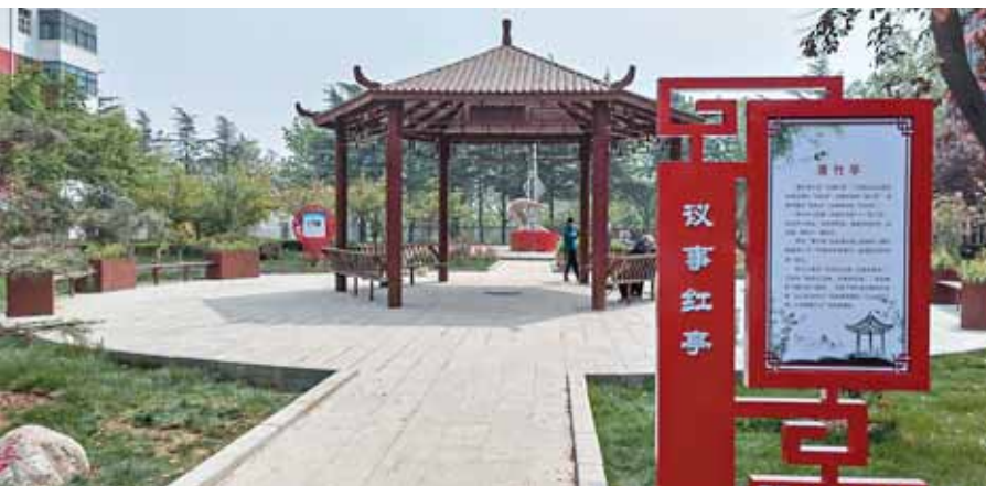
火电厂社区议事红亭,成为居民协商议事、休闲娱乐的场所。

本报讯 (记者 张婷媛 通讯员 周中芳)近日,山城区鹿楼街道火电厂社区党支部成功创建省级“五星”支部,这也是该区唯一创建成功的城市社区党支部。这是3月7日记者从鹿楼街道了解到的。