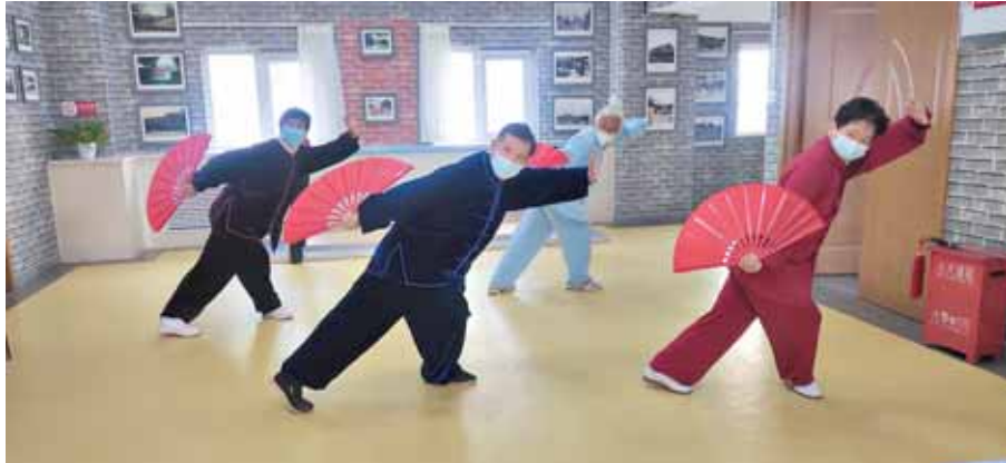
红旗街街道朝霞北社区居民在活动室健身。

本报讯 (记者 张婷媛)粉刷一新的楼体、整洁漂亮的游园广场、温馨和谐的邻里生活……近日,记者走进山城区红旗街街道,一幅幅幸福美好的画卷映入眼帘。