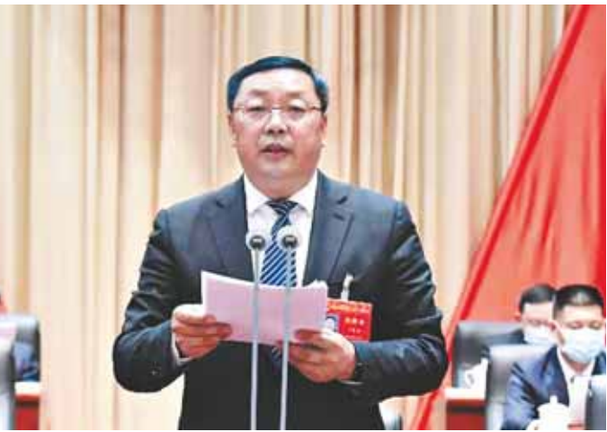
3月23日,在鹤壁市第十二届人民代表大会第二次会议上,市委书记马富国作了讲话。