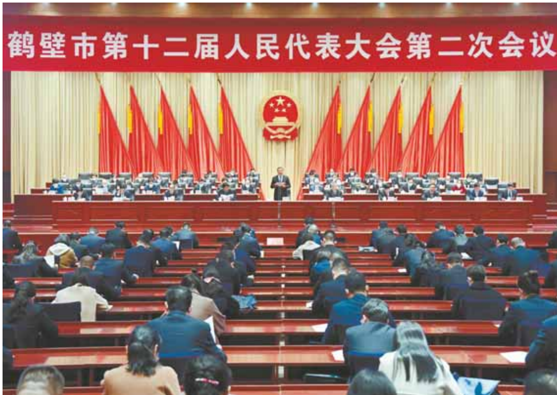
上图 3月23日,鹤壁市第十二届人民代表大会第二次会议召开。