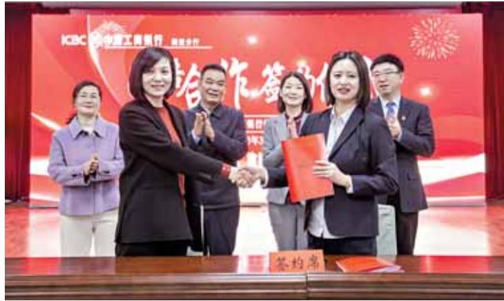
工行鹤壁分行与市供销社签署战略合作协议,“金融+供销”助力乡村振兴。

会等方式对接中小微企业,把握融资需求,针对重点行业和客群开展分层营销。通过挖掘个体工商户、小微商户等小额客户资源,抓住客户群体下下沉、额度小、周转快的