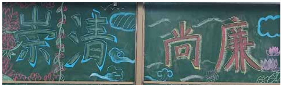
学生自办的廉洁主题黑板报。

执着。在青年洞前,党员们重温入党誓词。全体党员干部通过实地参观学习,进一步扛牢了为党育人、为国育才的光荣使命。大家纷纷表示,要在奋斗新时代、奋进新征程中,把红旗渠精神转化为工作的强大精神动力,廉洁自律、扎实工作,为党的教育事业贡献智慧和力量。