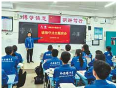
开展诚信守法主题班会。