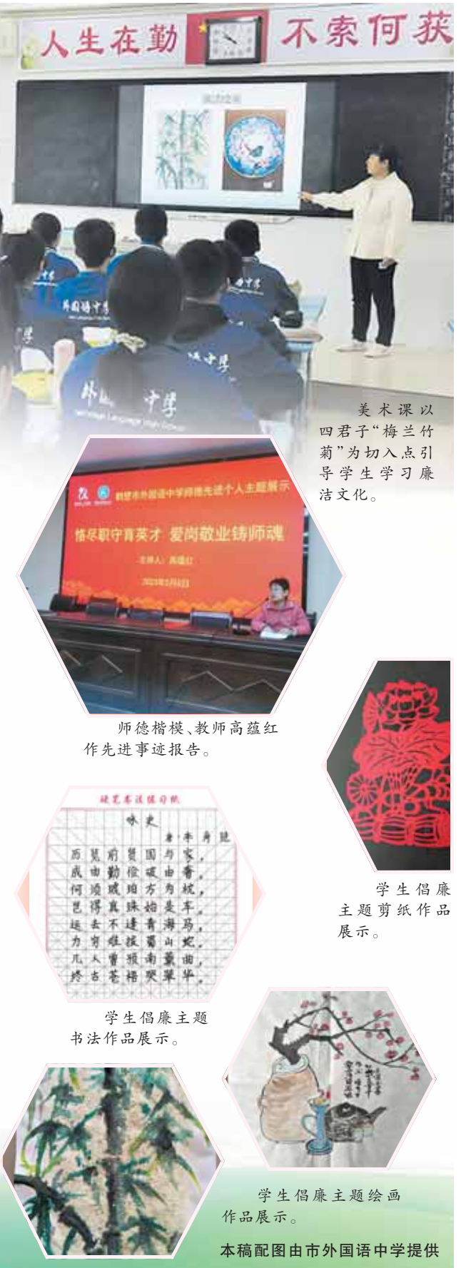
美术课以四君子“梅兰竹菊”为切入点引导学生学习廉洁文化。

师生表示,要牢固树立廉洁观念,努力践行“清清白白做人,干干净净做事”的廉洁理念,筑牢“廉洁从业、拒腐防变”的思想道德防线,为教育事业高质量发展贡献最大力量。