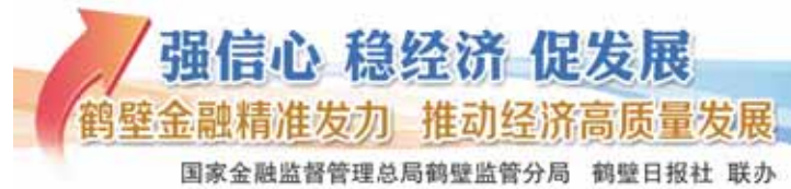
国家金融监督管理总局鹤壁监管分局 鹤壁日报社 联合

县农商银行为新镇韭菜、善堂花生等特色农产品产业发展提供已超过1000万元的专项信贷资金支持,为浚县“一村一品,一镇一业”打造、促进“三农”高质量发展发挥了强有力的金融支撑作用。