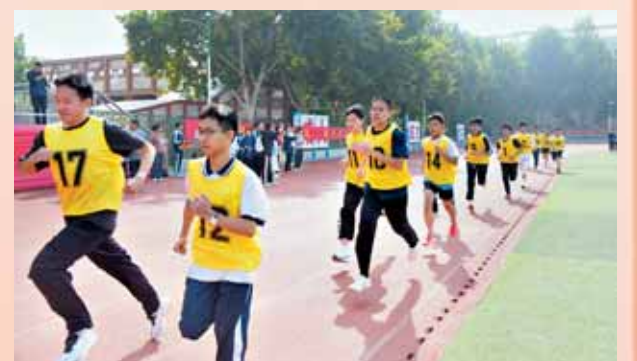
长跑运动员从容应对