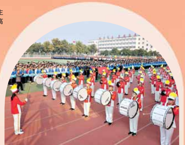
校鼓号队为开幕式奏乐