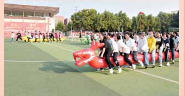
旱地龙舟接力赛趣味十足