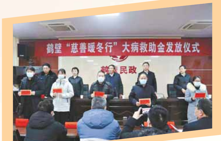
2022年1月25日,鹤壁市慈善联合总会举行鹤壁“慈善暖冬行”大病救助金发放仪式。