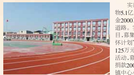
由慈善资金支持重建的新镇镇辛选小学,面貌焕然一新。

在全市上下同心同德,为慈善事业发热发力时,市慈善联合总会强化使命担当,打造慈善品牌,实施精准救助,使我市慈善事业取得了重要成就。