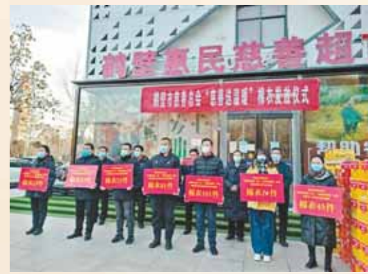
2022年12月1日,鹤壁市慈善联合总会举行“关爱你我他(她)·慈善送温暖”棉衣发放仪式。

大灾无情,人间有爱。近年来,市慈善联合总会不忘初心、不负使命,积极投身抗洪救援、疫情防控等重大慈善援助行动,与受灾群众风雨同舟、共渡难关。