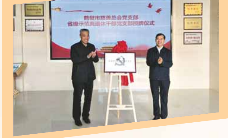
2021年10月28日,鹤壁市慈善联合总会党支部被省委组织部、省老干部局授予“全省示范离退休干部党支部”称号。

此外,市慈善联合总会还在全市大力实施了“幸福家园”村社互助工程,确定100个村社做为省、市试点示范村,提升了村社服务群众能力和群众的幸福感,为实施精准扶贫战略提供了更多慈善新思路,构建出人人参与的新时代大慈善格局。