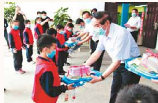
2020年5月20日,鹤壁市慈善联合总会在市松江小学举行“慈善书屋”揭牌赠书仪式。

为持续深化“人人参与慈善,人人皆可慈善”的“全民慈善”社会氛围,市慈善联合总会持续加强与主流媒体合作,积极拓宽新闻宣传渠道,全方位地展示慈善工作动态,提升慈善典型的感召力,引导社会公众关心慈善、支持慈善、参与慈善。制作了慈善宣传片,连续六年在新世纪广场举办“中华慈善日”和“慈善法”宣传活动。在国家级报刊刊发系列报道76篇,在省报报刊发表报道124篇,在市级媒体发表报道261篇,在今日头条App等发表作品81篇。