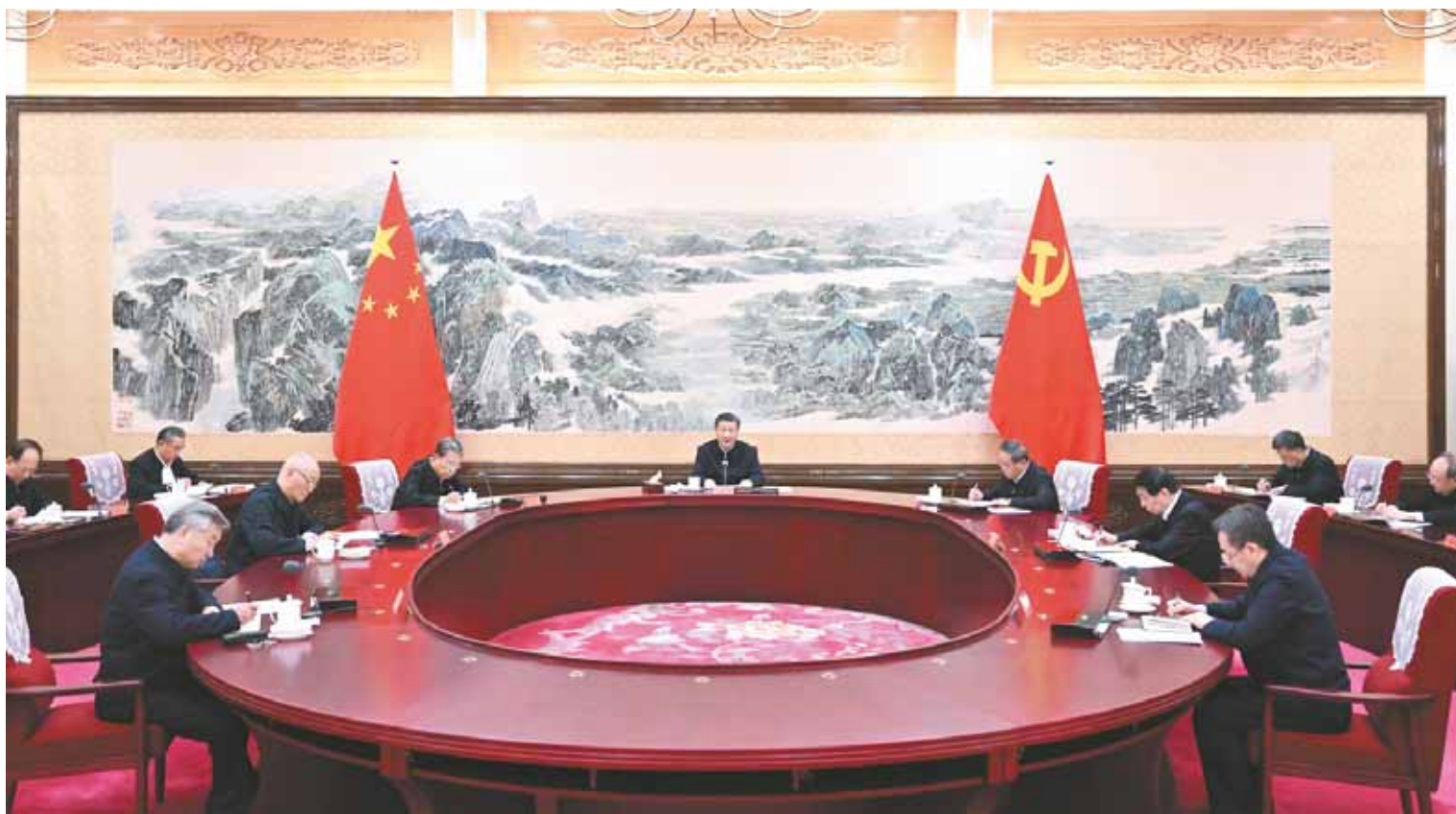
12月21日、22日,中共中央政治局召开学习贯彻习近平新时代中国特色社会主义思想主题教育专题民主生活会,中共中央总书记习近平主持会议并发表重要讲话。