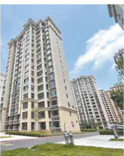
南水西郡被列入保交楼项目的10栋450套房已全部交付使用