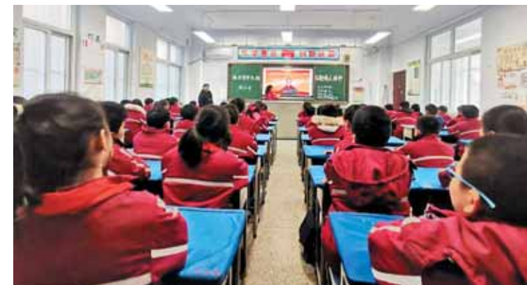
近日，山城区第八小学通过开展主题班会、主题队会、经典名句诵读等系列教育活动，号召全体师生

整场演出掌声不断，现场激情四溢。飞扬的歌声吟唱着奋斗时光，唱出了新时代的幸福生活，激发了师生昂扬向上奋进2024年的豪情壮志，表达了爱党、爱国、爱社会主义的真挚情感。