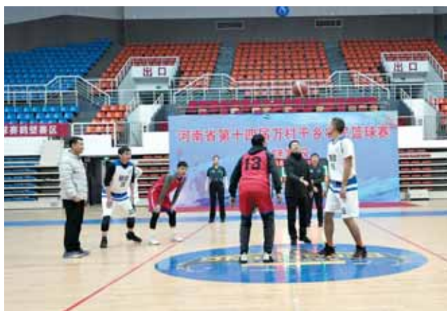
首场比赛开球现场