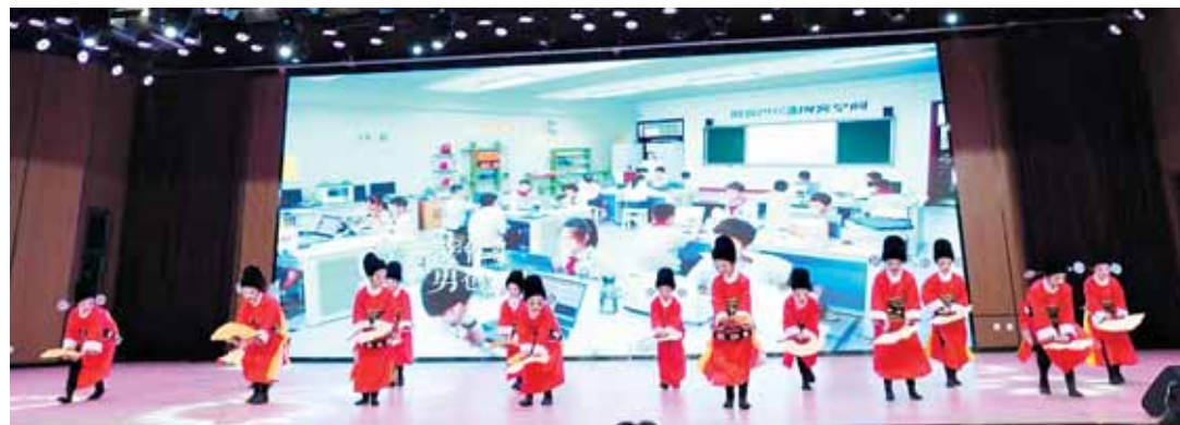
戏歌舞蹈《夸一夸咱鹤壁教育人》

典礼还表彰了105名“鹤壁市中小学幼儿园优秀班主任”，赞誉他们用自己的人格力量和情感力量引导、爱护、教育学生，把满腔热情和充沛的精力奉献给学生。歌曲《好老师》、诗朗诵《闪亮