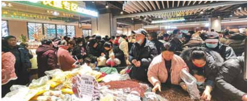
农垦购物中心开业当天吸引了众多市民前来选购