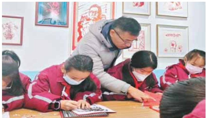
学生在老师的指导下制作剪纸作品