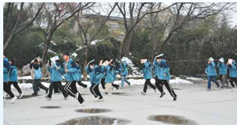
防震减灾应急演练现场