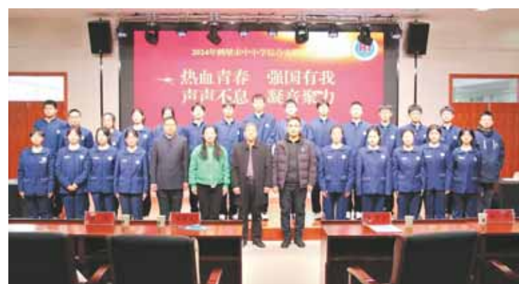
与会领导与学生合影留念