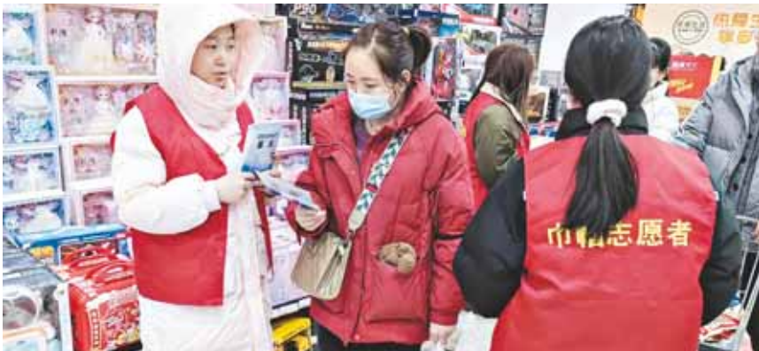
2月4日,浚县妇联组织巾帼志愿者在便民服务超市周边开展“巾帼普法基层行·法治教育进万家”活动。本次活动聚焦“四大一送·情暖百姓”主题,活动中,巾帼志愿者向过往群众发放了民法典宣传页、防范电信诈骗宣传册及谨防养老诈骗宣传页等。