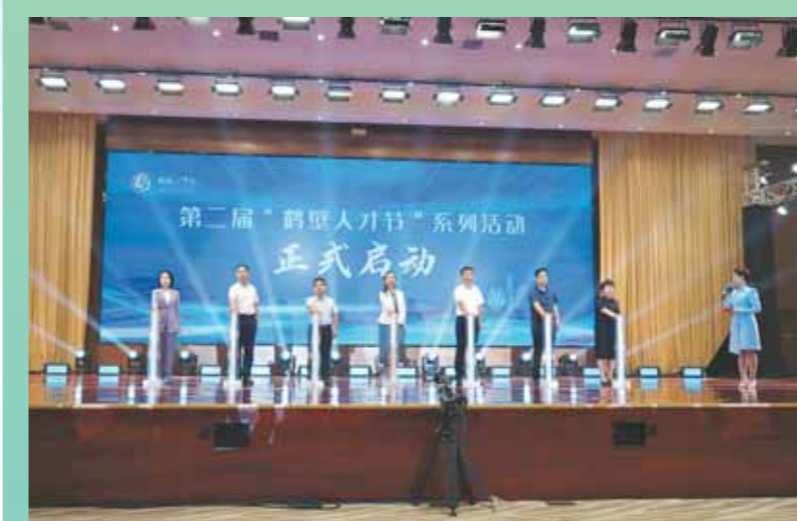
第二届“鹤壁人才节”启动仪式