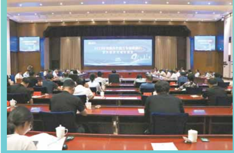
2023年7月,“院士中原科技行”和“院士座谈会”活动在鹤壁市举行。