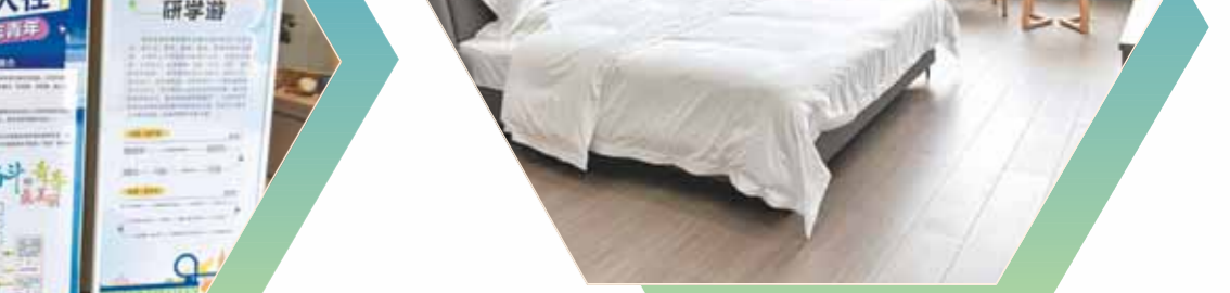
淇滨区人才公寓一角

我市构建了“青年人才驿站”服务体系,吸引更多优秀青年人才来鹤壁创业发展。建成青年人才之家2个,提供政策咨询、就业指导等综合服务;首批“青年人才驿站”选定16家酒店民宿,可提供1800个床位,最长免费住宿7天;招募餐饮、娱乐、健身、旅游等青年人才体验联盟商家68个,提供消费优惠服务。积极创新人才服务阵地,为青年人提供休闲娱乐和社交文化空间,激活超越城市发展的