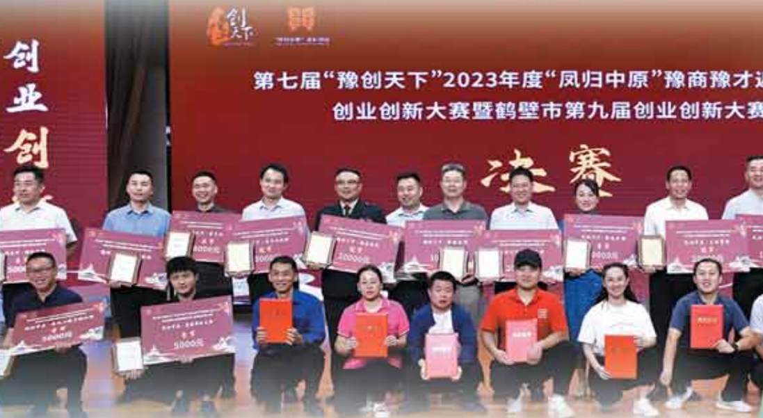
鹤壁市第九届创新创业大赛获奖选手