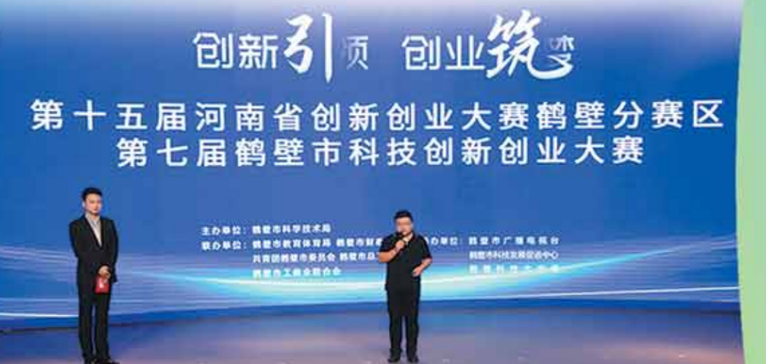
第七届鹤壁市科技创新创业大赛参赛选手正在路演