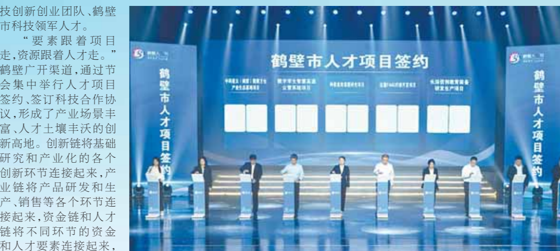
第二届“鹤壁人才节”人才盛典活动上项目签约

“鹤壁市人才项目签约”是“鹤壁人才节”的重要环节,旨在通过项目签约,形成产业场景丰富、人才土壤肥沃的创新高地。创新链将基础研究和产业化的各个环节创新环节连接起来,产业链将产品研发和生产、销售等各个环节连接起来,资金链和人才链将不同环节的资金和人才要素连接起来,形成彼此关联的“毛细血管”,从而引导生产要素合理流动,众多先进技术和创新成果、高端人才落户鹤壁,把优质资源留在鹤壁,助力鹤壁产业转型升级。