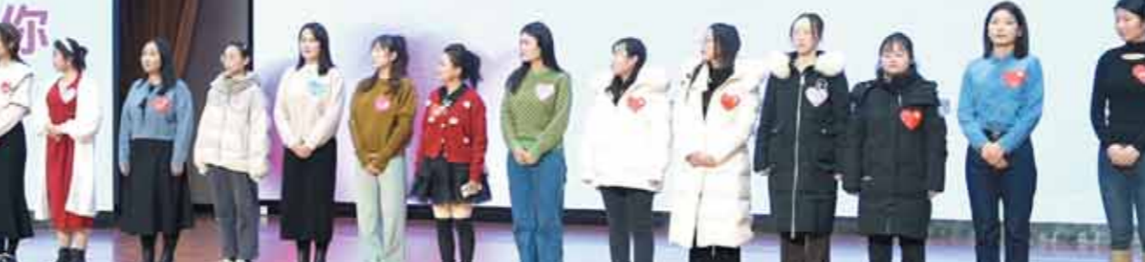
2024年10月22日,“职”在鹤壁,“缘”来是你单身青年人才联谊会成立仪式暨首场联谊活动现场。