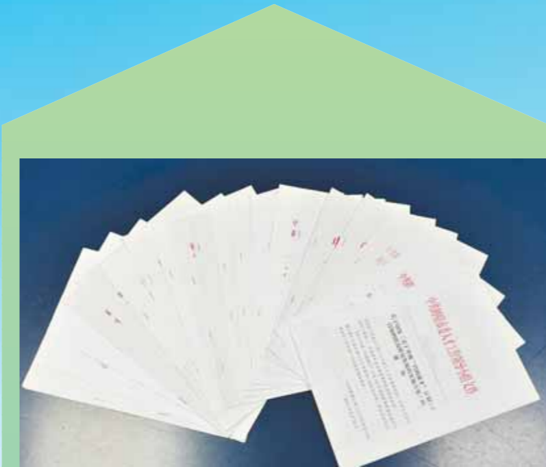
鹤壁市人才政策汇总