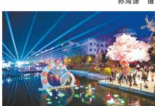
淇滨区“樱花里”文化旅游休闲街区夜景璀璨

从第九届中国(鹤壁)樱花文化节的出圈出彩,到淇河休闲、多彩康养、浪漫城市、文化研学、非遗展示等主题特色活动的沉浸式开展,2023年,踏着文旅和鸣的节拍,淇滨区成为近悦远来之城。