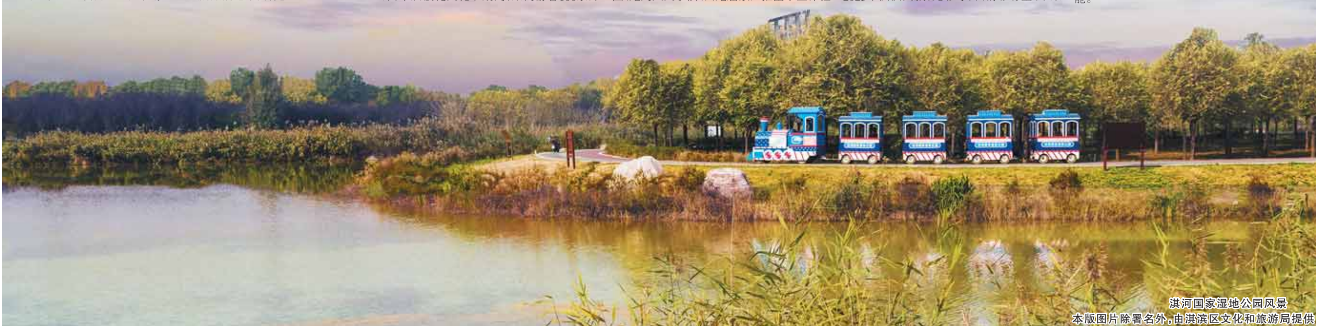
淇河国家湿地公园风光