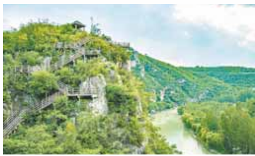
桑园小镇淇河谷玻璃栈道

淇滨区文旅局推出创意“早安”主题线上美景日历、“中国诗河·淇美如歌”系列短视频等,以“文字+图片+视频”等形式大力宣传特色资源,推动“淇滨文旅”知名度、美誉度不断提升。坚持一手抓报刊、电视、广播等传统媒体平台宣传,一手抓抖音号、视频号、微信公众号等新媒体平台宣传,淇滨文旅“出镜率”显著提高,“中国诗河·淇美如歌”文旅品牌愈发响亮。