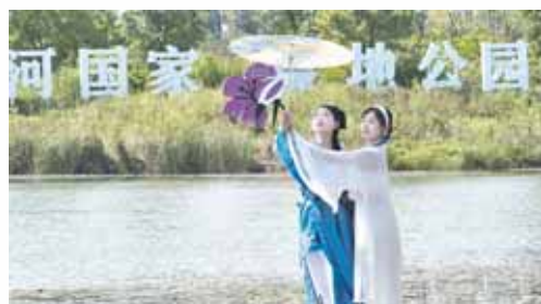
淇河国家湿地公园实景演出