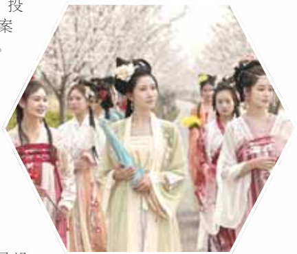
十二花神打卡鹤城

淇滨区文旅局创新提出“1+2+N”监管亮化模式,“1+2+N”即1名领导+2名专家+N个执法部门,通过“行业亮家底、监管亮短板、经营亮措施、统一亮形象”对公示,促进企业主体责任落实。率先推出文娛场所“白名单”机制,扎实推进文旅行业规范管理,2023年全年未发生安全生产事故和重大旅游投诉案件。